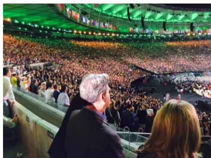
スタジアムは満員。4時間にわたる盛大な開会式でした。