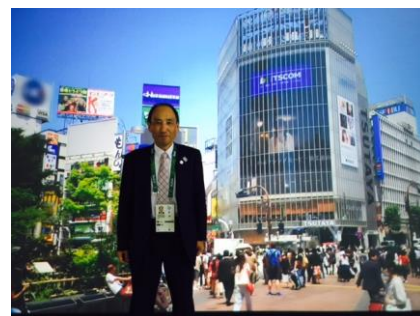
同じくジャパンハウスにて、渋谷を紹介するスクリーン。