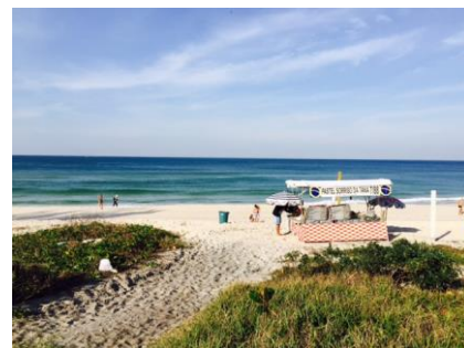
滞在したホテル前には美しいビーチが広がっていました。