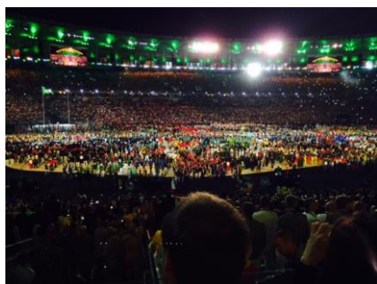
リオ五輪の開会式。8月5日、マラカナン・スタジアムにて。