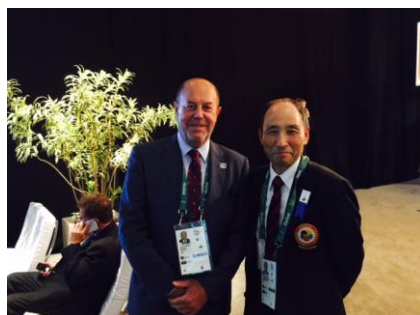
IOC総会で空手採用が決まった直後、エスピノス会長と。