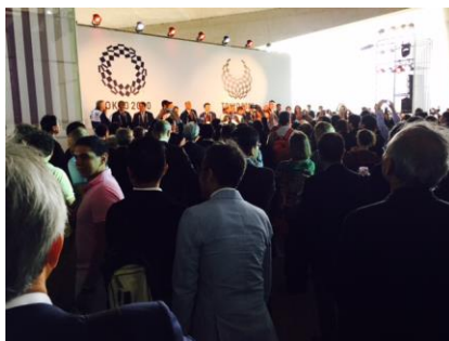
リオの「ジャパン・ハウス」レセプションにて、鏡割り。