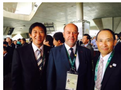
鈴木大地スポーツ庁長官と、ジャパンハウスにて。