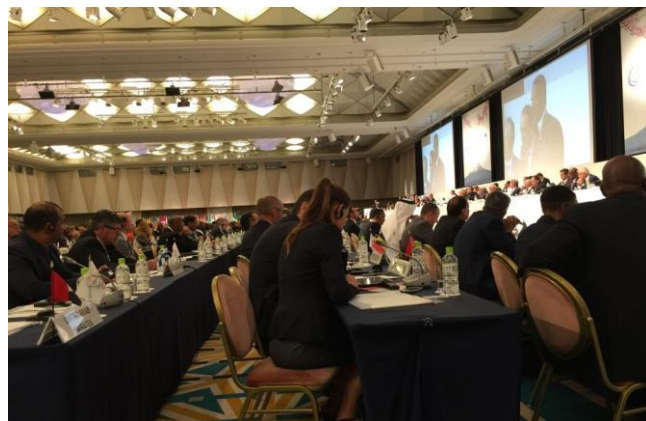
2019年ANOC総会(東京・品川)。